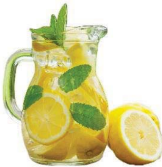
-Zitronen-Rosmarin 0,5l / 4,80

Unsere ausführlichen Allergene und Zusatzstoffliste darfst du gerne bei unserem Personal anfragen.