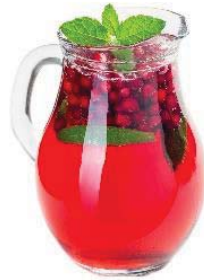
-Wild-Berry 0,5l / 4,80