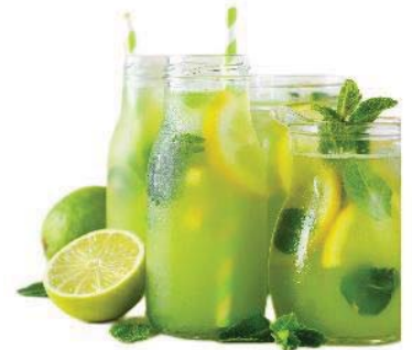
-Limetten-Ingwer 0,5l / 4,80