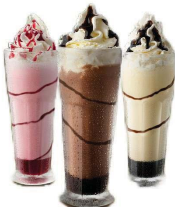
-Erdbeere 0,5l / 5,80 -Vanille 0,5l / 5,80 -Schoko 0,5l / 5,80