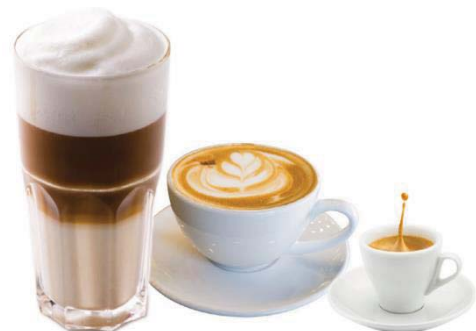
-Espresso / 1,80 -Espresso Doppelt / 2,90 -Espresso Macchiato / 3,20 -Café Crema / 2,00 -Cappuccino / 3,90 -Latte Macchiato / 4,50 -Tee (Grün, Minze, Kamille, Schwarz, Früchte, Kräuter) / 2,90